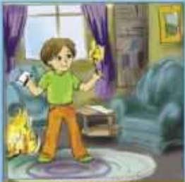
Неосторожное обращение с огнем