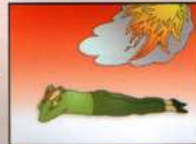
Закрывать голову руками (одеждой)