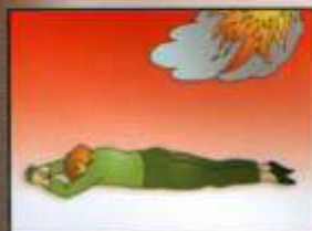
Сразу же упасть на пол