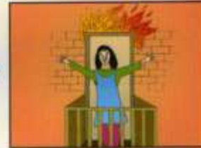
При невозможности покинуть помещение подавать спасателям сигналы с балкона или из окна