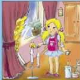
Игры с огнем