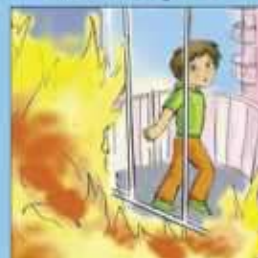
Если выйти невозможно, найти источник свежего воздуха, выбраться на балкон