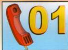
Сообщить о пожаре по телефону 01