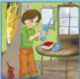
Вызвать пожарных по телефону 01