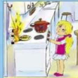
Газовые и электроплиты