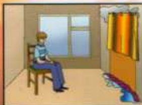
Плотно закрыть за собой дверь и вернуться в помещение