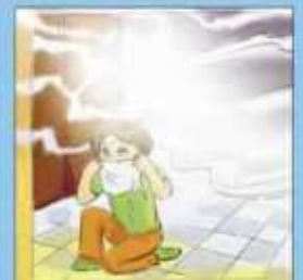
В задымленном помещении дышать через мокрую ткань