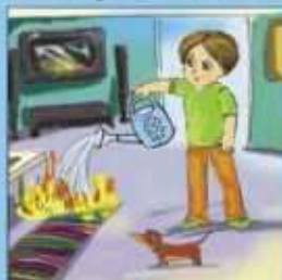
Мелкое возгорание потушить подручными средствами