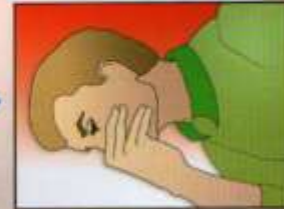
Задержать дыхание до прохождения огня