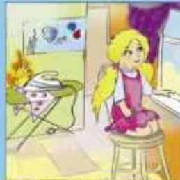
Оставленные без присмотра электроприборы