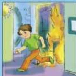
Если это невозможно, срочно покинуть помещение