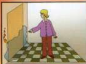
Оценить обстановку и определить, откуда исходит опасность