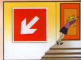
Закреть за собой дверь и двигаться к выходу

ВНИМАНИЕ! Если лестничная клетка задымлена, следует накрыться мокрой плотной тканью и двигаться к выходу, пригнувшись или ползком.